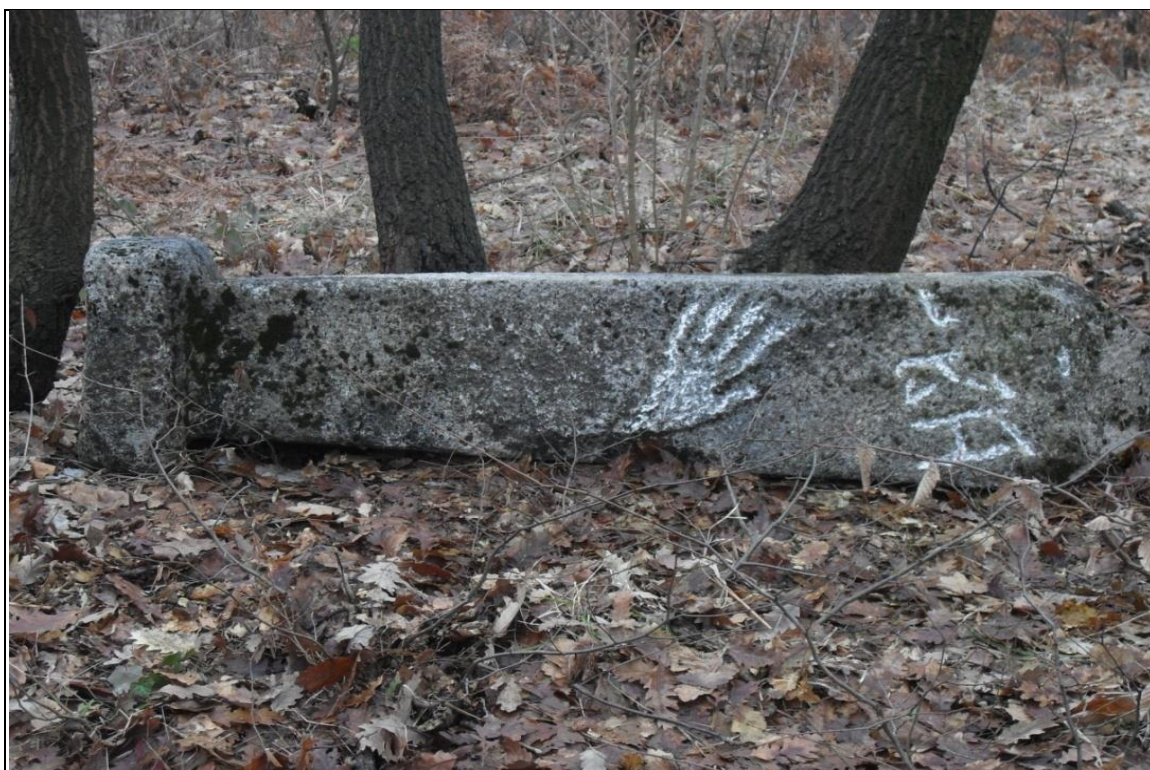
PRILOG 4: Prednja strana sa primjetnim oštećenjem motiva otvorene šake