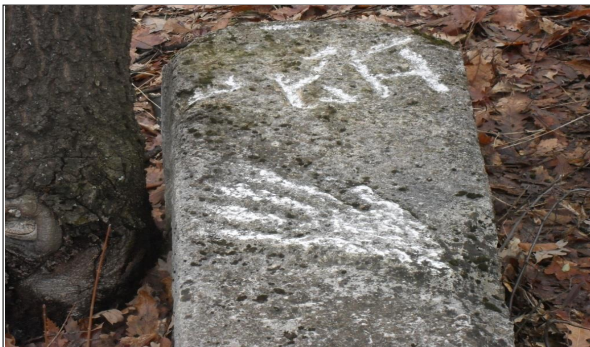
PRILOG 1: Prednja strana nišana sa motivom otvorene šake i zapisom na bosančici