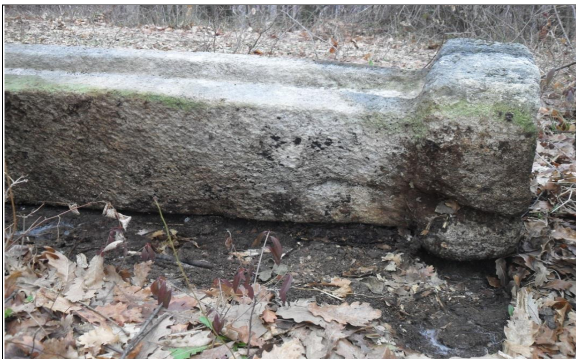
PRILOG 3: Postolje prednjeg nišana koje je u nesrazmjeri sa visinom samog nišana