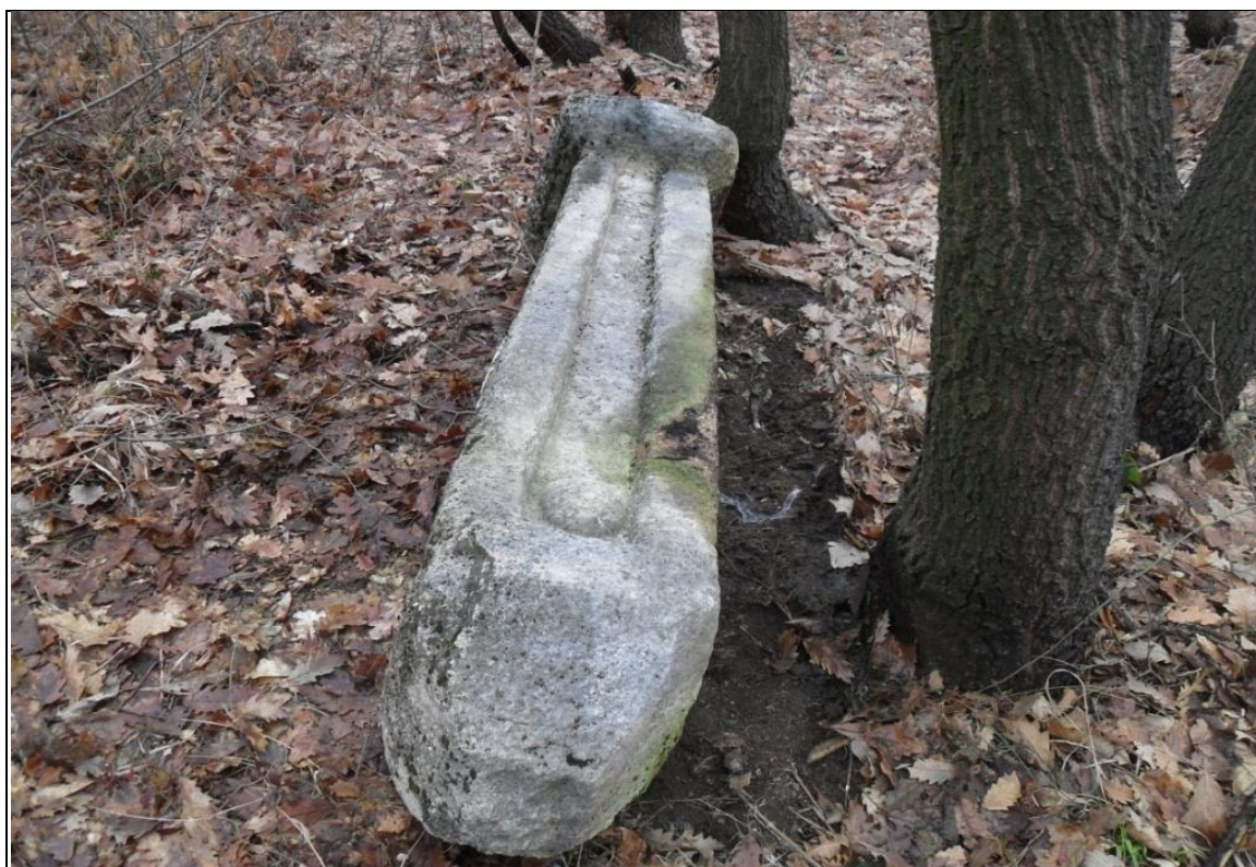
PRILOG 2: Bočna strana prednjeg nišana sa žlijebom i poluloptom